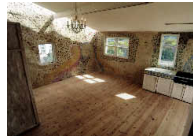
元住吉 6階テラスハウス