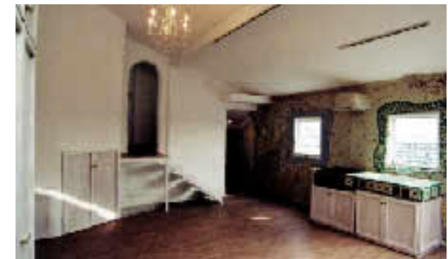
6Fにはタイルの壁のテラスハウスを増築