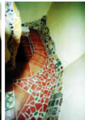
普通のビル階段がカジュアルに変身